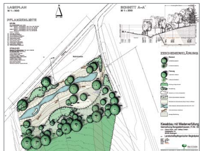
Mit den Layoutfunktionen erstellen Sie Pläne mit unverwechselbarer Handschrift. (Lageplan Burgadelzhausen, Mayr & Robbe Landschaftsarchitekten, Gablingen, D)