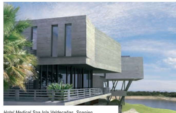
Hotel Medical Spa Isla Valdecañas, Spanien Miguelangel Gea & Asociados Arquitectos, Sevilla